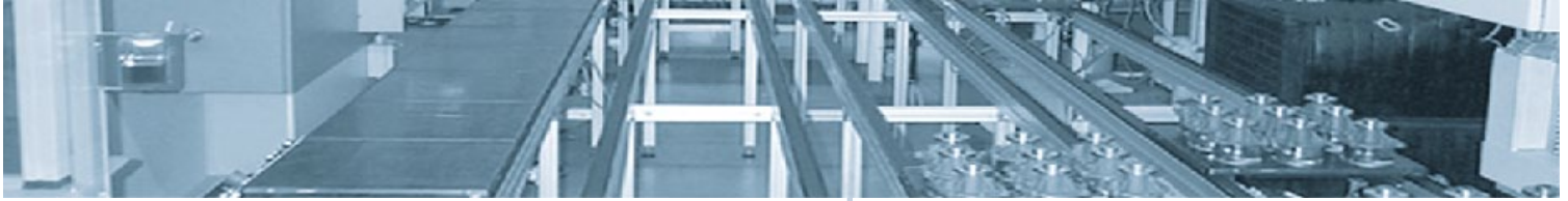
APA GmbH Anlagen- & Produktionsmaschinenbau