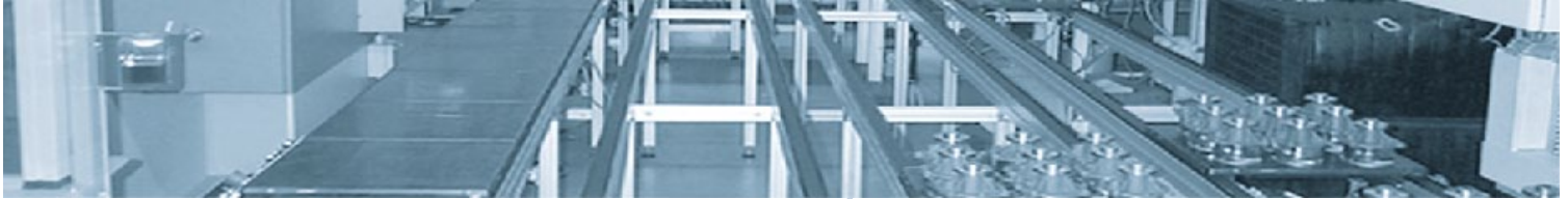
APA GmbH Anlagen- & Produktionsmaschinenbau